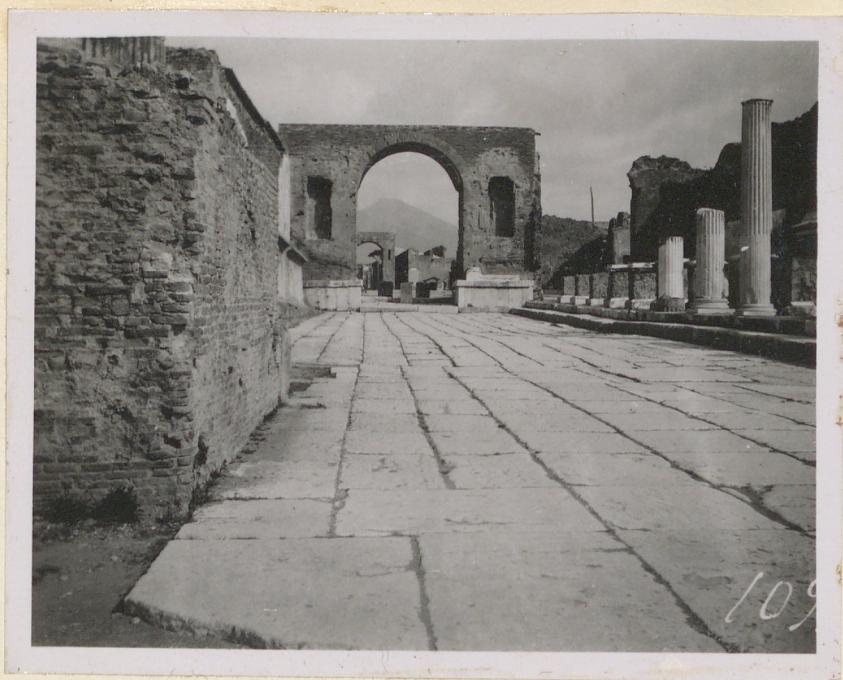
N°80a. L'arco di Tiberio o di Germanico.