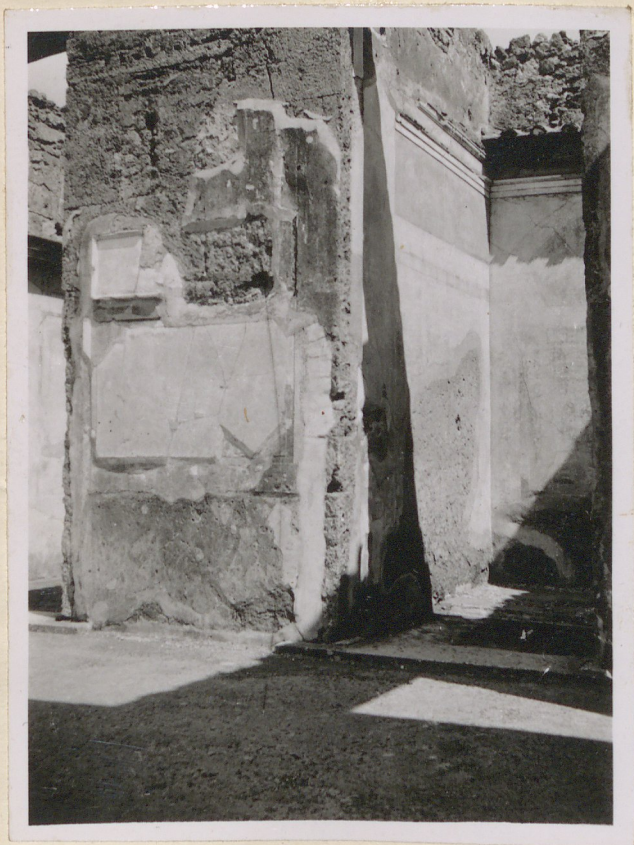
N° 22 .